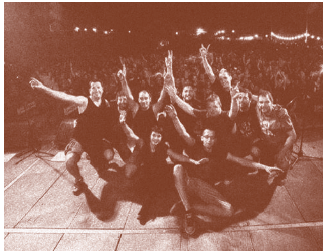
Los Draps a l'Aplec dels Ports de Villores, 2016